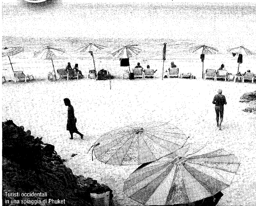
Turisti occidentali in una spiaggia di Phuket

4 miliardi di dollari l'anno il giro d'affari del turismo sessuale in Thailandia